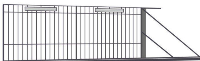
Brama przesuwana z automatem w słupku Szer. 4,00 m x Wys. 1,50 m L nr: 5903641455930 P nr: 5903641455947