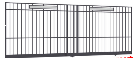
Brama przesuwana segmentowa z automatem Szer. 4,00 m x Wys. 1,50 m L nr: 5903641455916 P nr: 5903641455923