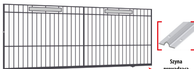
Brama przesuwana bez przeciwwagi Szer. 4,00 m x Wys. 1,50 m L nr: 5903641455879 P nr: 5903641455886 Z automatem L nr: 5903641455893 Z automatem P nr: 5903641455909