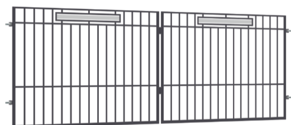
Brama dwuskrzydłowa Szer. 4,00 m x Wys. 1,50 m nr: 5903641455695 Z automatem nr: 5903641455701 Z automatem inteligentna nr: 5903641455718