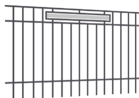
Przęsło Szer. 2,00 m x Wys. 1,20 m nr: 5903641455787