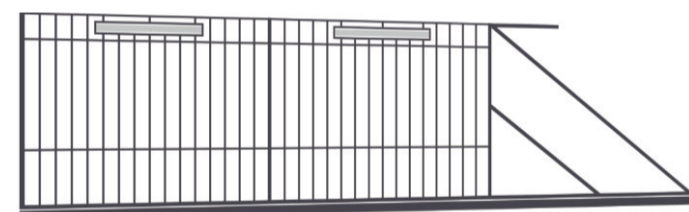
Brama przesuwana z zamkiem hakowym Szer. 4,00 m x Wys. 1,50 m L nr: 5903641455794 P nr: 5903641455800 Z automatem L nr: 5903641455817 Z automatem P nr: 5903641455824