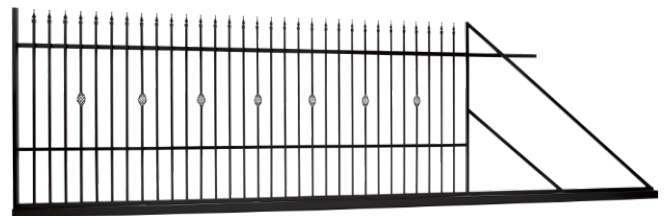
Brama przesuwna z zamkiem hakowym Szer. 4,00 m x Wys. 1,50 m L nr: 624336 P nr: 624337 Z automatem L nr: 624857 Z automatem P nr: 624858 Szer. 5,00 m x Wys. 1,50 m L nr: 634931 P nr: 634932 Z automatem L nr: 634933 Z automatem P nr: 634934