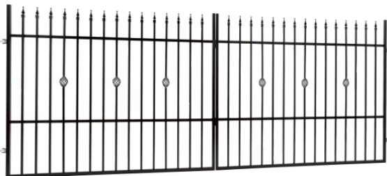
Brama dwuskrzydłowa Szer. 4,00 m x Wys. 1,50 m nr: 622850 Z automatem nr: 624853 Szer. 3,50 m x Wys. 1,50 m nr: 637480 NOWOŚĆ Szer. 5,00 m x Wys. 1,50 m nr: 637487 NOWOŚĆ