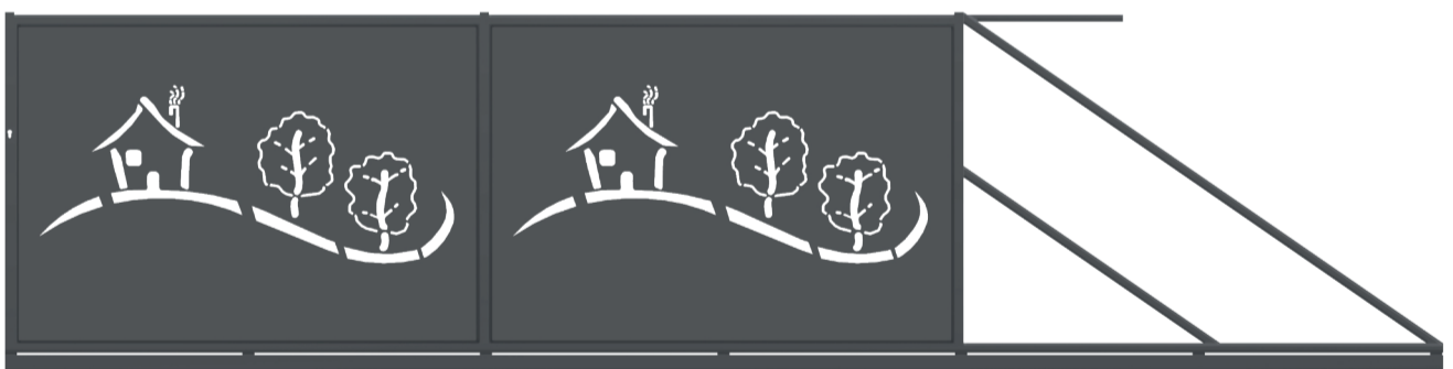
Brama przesuwna z zamkiem hakowym Szer. 4,00 m x Wys. 1,50 m L nr: 5905235218204 P nr: 5905235218211 Z automatem L nr: 5905235218228 P nr: 5905235218235