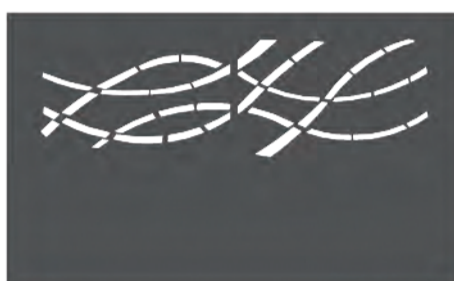
Przęsło Szer. 2,00 / Wys. 1,50 m nr: 5905235217313 / Wys. 1,20 m nr: 5905235217306