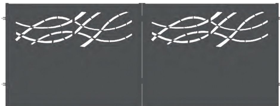
Brama dwuskrzydłowa Szer. 4,00 m x Wys. 1,50 m nr: 5905235217108 Z automatem nr: 5905235217115