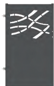
Furtka Szer. 0,90 m x Wys. 1,50 m L nr: 5905235217177 P nr: 5905235217504