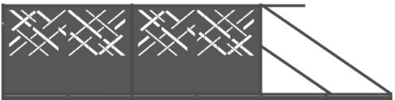
Brama przesuwna z zamkiem hakowym Szer. 4,00 m x Wys. 1,50 m L nr: 5905235218426 P nr: 5905235218433 Z automatem L nr: 5905235218440 P nr: 5905235218457