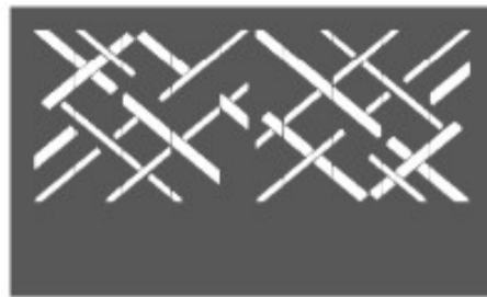
Przęsło Szer. 2,00 m x Wys. 1,20 m nr: 5905235218419